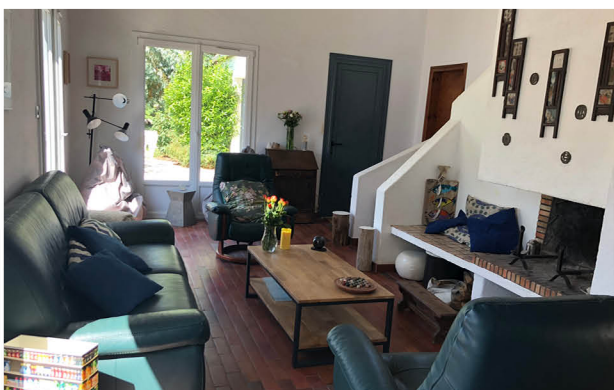
Salon / cheminée